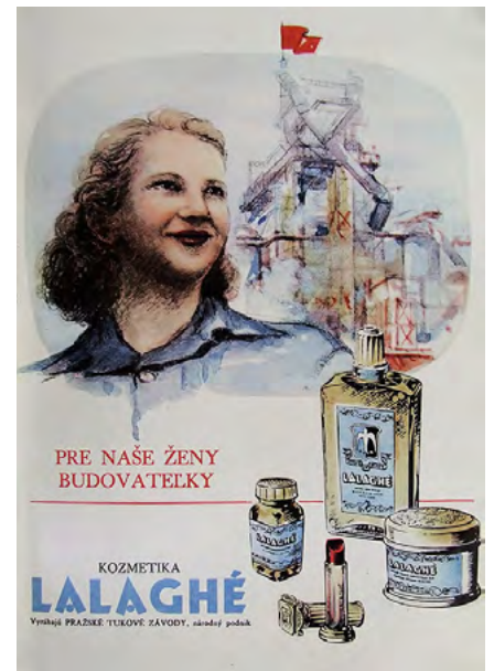
Reklama na kozmetiku Lalaghé. Reprodukcia z časopisu Móda - textil. 1952/1.