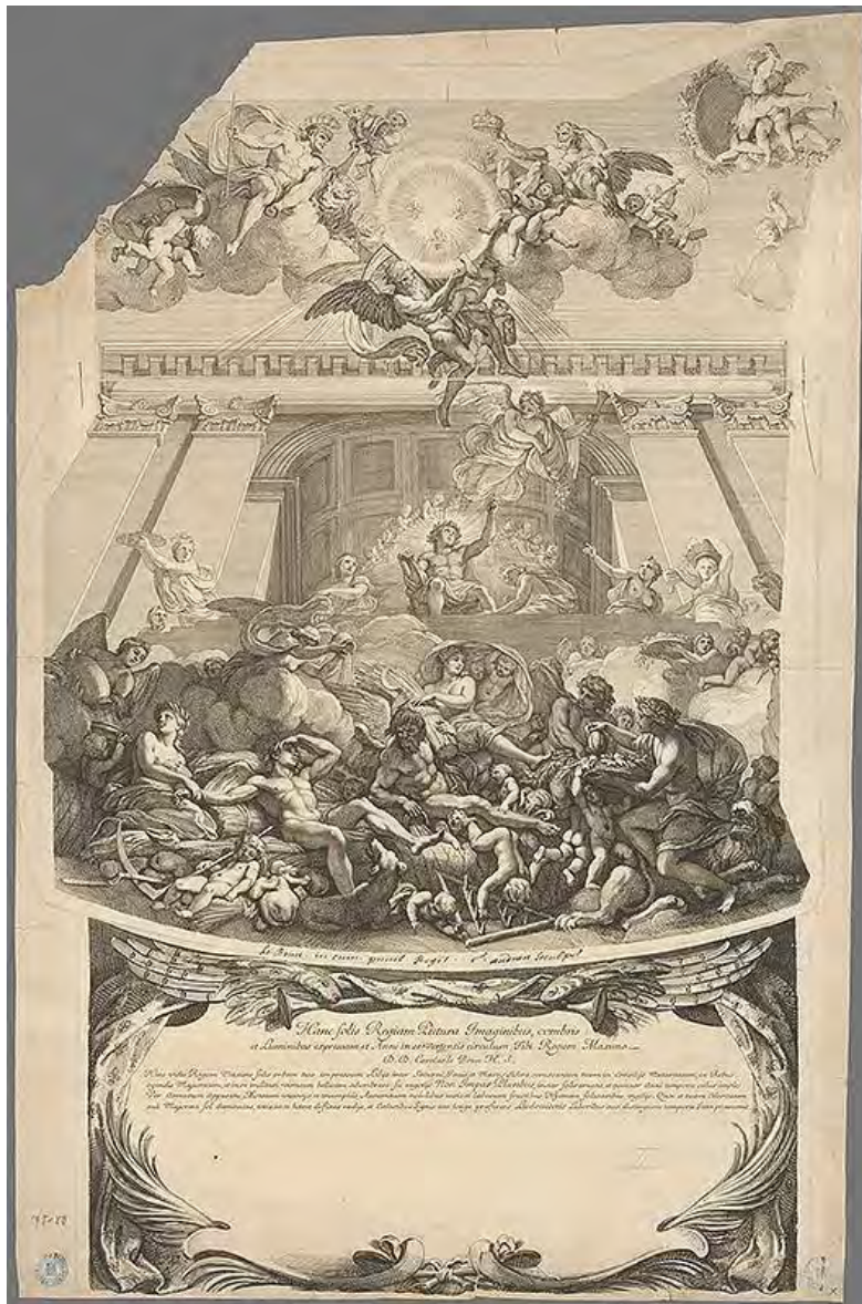
Jean Audran: Apoteóza Ľudovíta XIV. 1750 – 1756. Galéria mesta Bratislavy.

Akým spôsobom sú vykreslené obe osobnosti? Prečo? Čo je cieľom oboch diel?